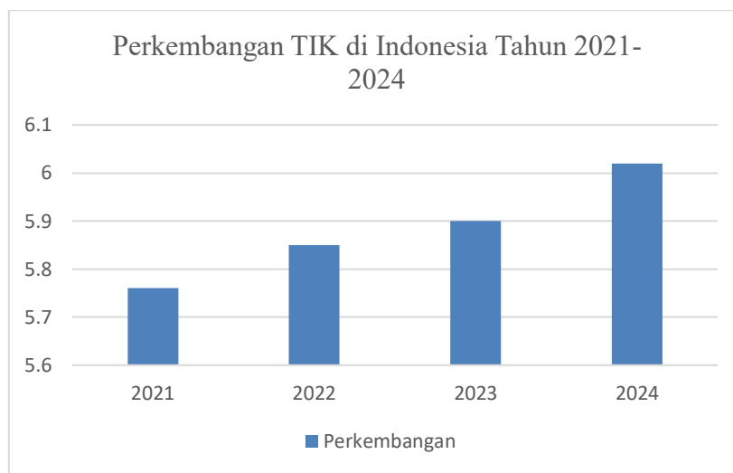
Gambar 1- 1 Perkembangan TIK Tahun 2021-2024

Perkembangan teknologi di Indonesia dapat dilihat dari perkembangan Indeks Pembangunan Teknologi Informasi dan Komunikasi (TIK) Indonesia dalam rentang waktu tahun 2021 sampai 2024 yang diambil dari Badan Pusat Statistik (BPS).