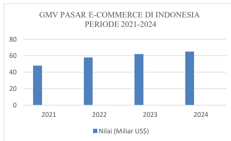
Gambar 1- 2

commerce dari tahun ke tahun. Gross Merchandise Value (GMV) merupakan jumlah nilai kotor dari semua transaksi penjualan barang yang berlangsung pada suatu platform atau marketplace dalam periode waktu tertentu (ScaleOcean.com). Menurut data yang diambil dari Kementerian Perdagangan nilai GMV di Indonesia terus mengalami peningkatan selama tahun 2021 sampai 2024. Pada tahun 2024 nilai GMV mencapai USD 65 miliar dimana nilai ini lebih tinggi dari tahun-tahun sebelumnya.