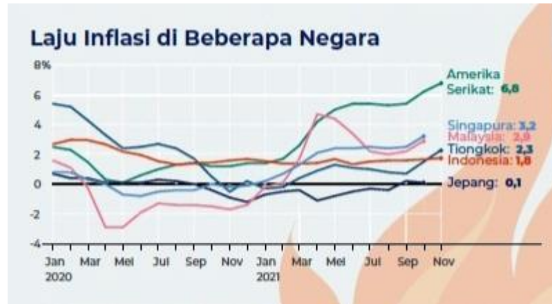
Gambar 2. Laju inflasi di beberapa negara Periode 2020 – 2021

Selain faktor internal, terdapat juga faktor eksternal yang dapat mempengaruhi return saham. Faktor lain ini diharapkan dapat memaksimalkan pencapaian return saham sehingga investor perlu melakukan analisis terhadap faktor eksternal. Tandililin (2001:211) menyatakan bahwa faktor eksternal yang menjadi pertimbangan dalam pembuatan keputusan investasi secara umum yaitu tingkat inflasi, tingkat suku bunga, nilai kurs dan pertumbuhan PDB negara tersebut terhadap indeks harga saham gabungan.