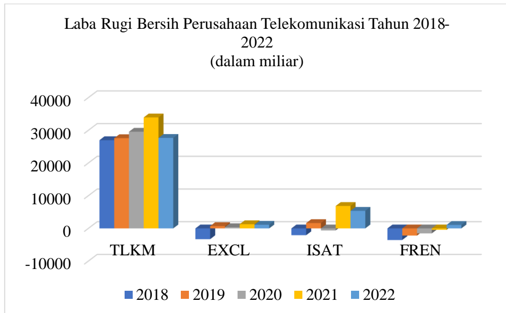
Gambar I.2 Grafik Laba Rugi Bersih Perusahaan Telekomunikasi Tahun 2018-2022 (dalam miliar)

Sumber : Data Sekunder Diolah Tahun 2023